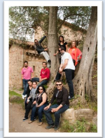
Arriba: En la Iglesia de Santa María de Lebeña.